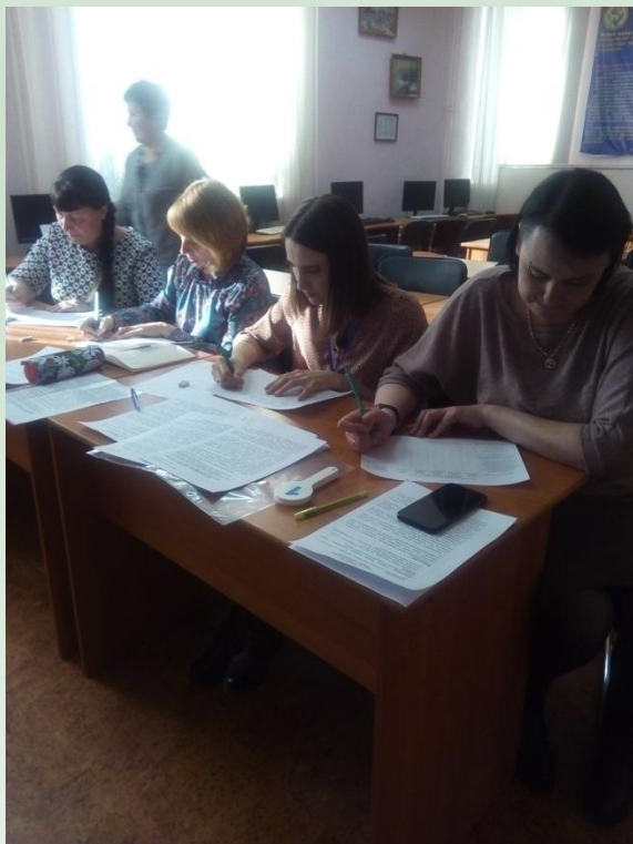
Педагоги-наставники в педагогическом колледже