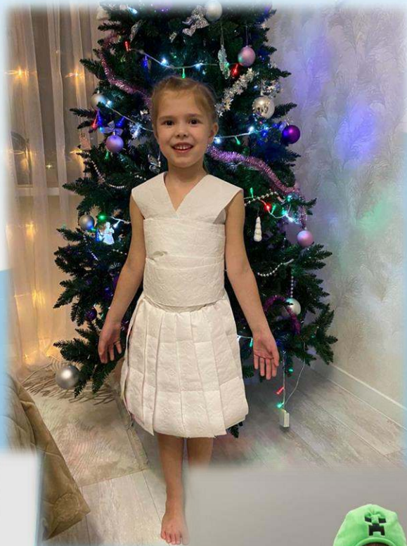
Фото с конкурса «Бумажные фантазии»: «Главное, чтобы костюмчик сидел»

Фото с экскурсии в магазин, где продают разные виды бумаги