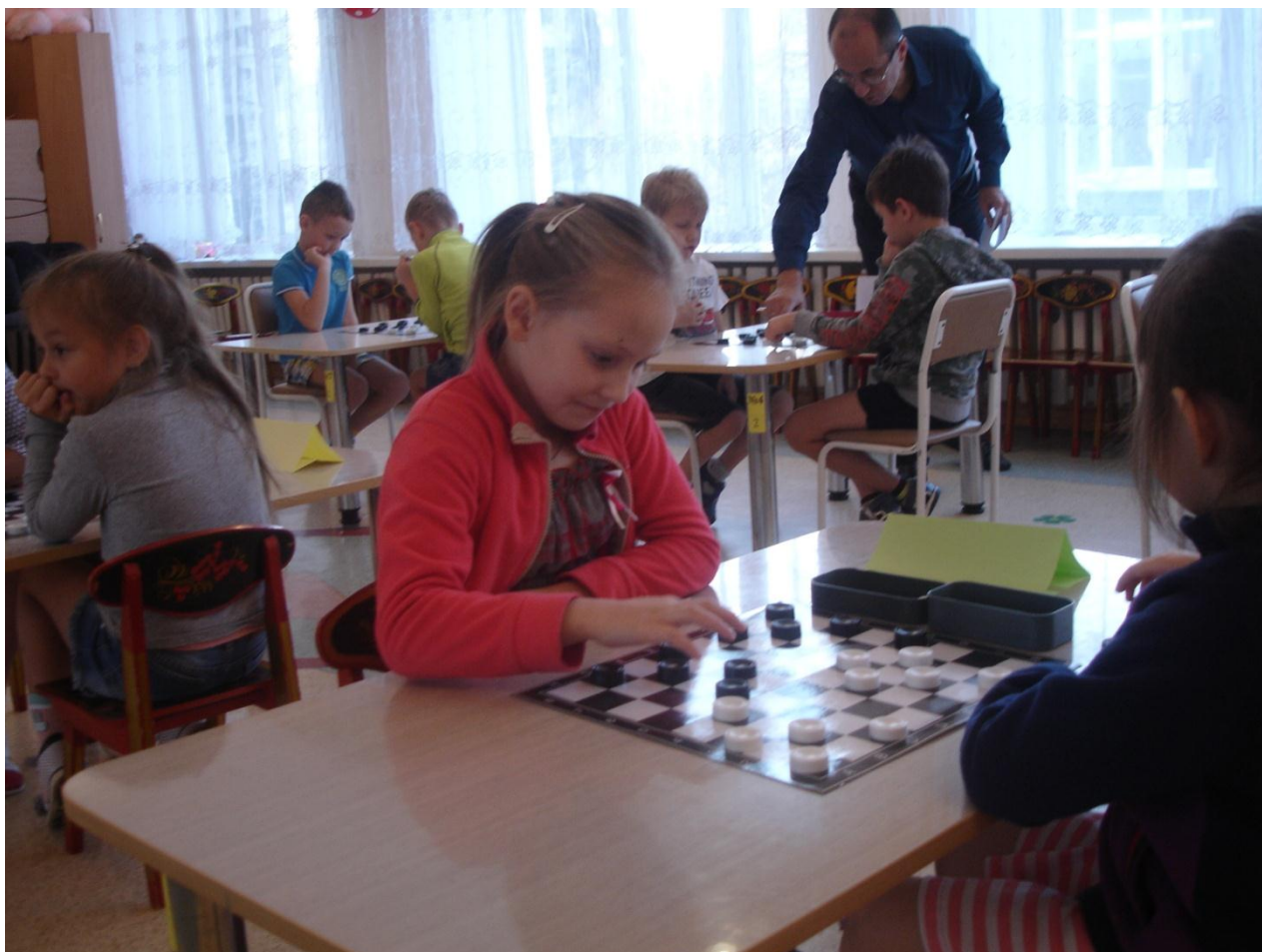
Шашечный турнир в детском саду. Апрель 2019 г.

САПЭУ (Сибирская Академия права, экономики и управления) сразу на третий курс, как раз в ту группу, в которой обучался и о.Георгий. Заканчивая обучение, получил предложение перейти на должность педагога-психолога в МБДОУ детский сад комбинированного вида № 19 г. Ангарска, которое с радостью принял, и где в настоящее время и работаю.