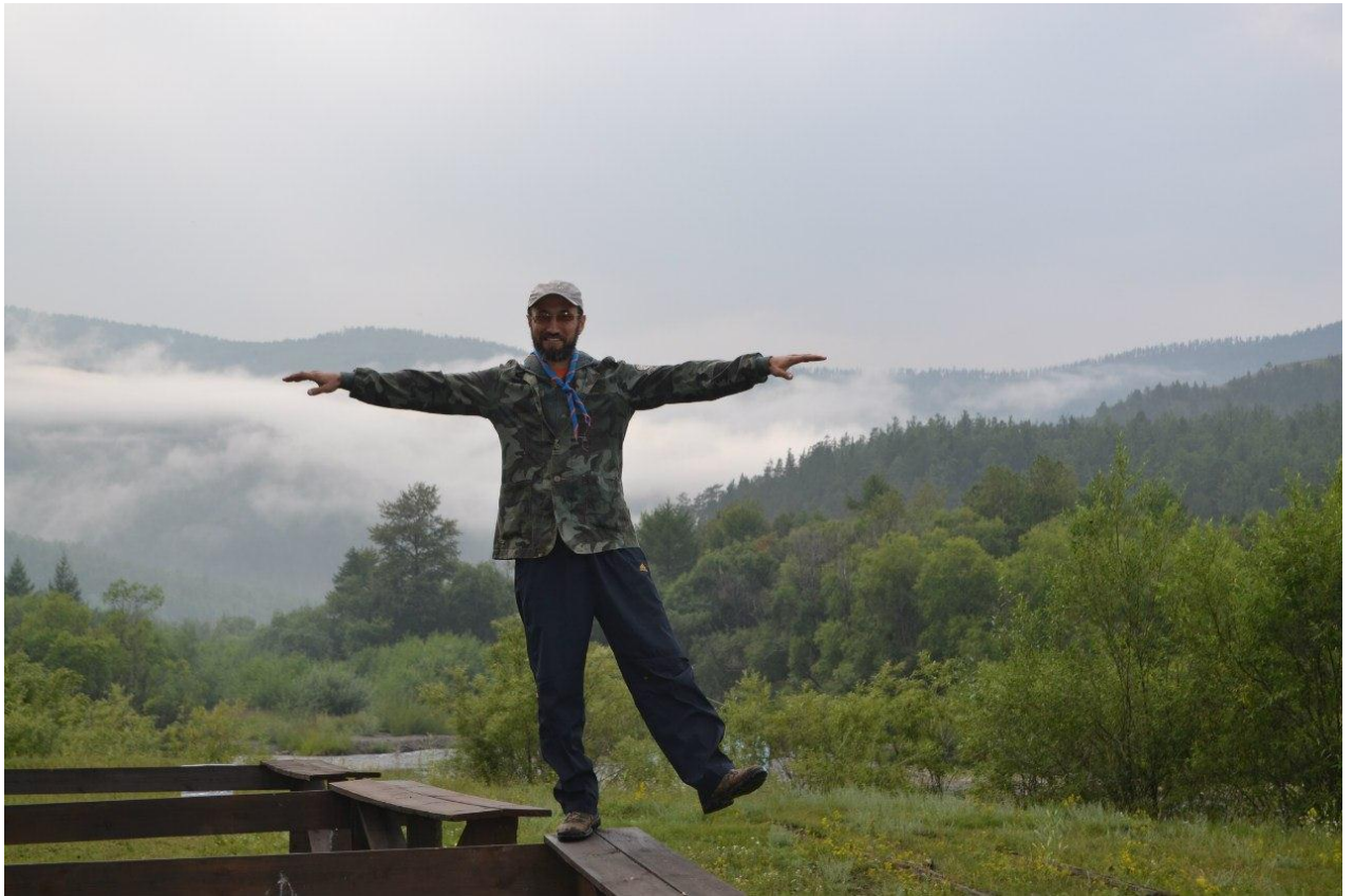
Июль, 2016 г. Байкал. Д. Б.Голоустное. Во время скаутской смены в лагере «Странник».